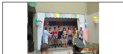
IMG. N° 001 Reinscripción Social Subprograma Psicosocial, EP. Santiago 1.

Comentario: : Con fecha 02-11-2015 se lleva a cabo presentación de números artísticos preparados por la población penal del Módulo 87, en alusión a la llegada de la primavera, actividad que fue preparada por el Subprograma Psicosocial con la activa participación de imputados del módulo 87.